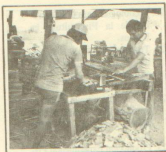
"Estudios Básicos y Aplicados de la Madera".

En el marco del Proyecto "Estudios Básicos y Aplicados de la Madera", se ha efectuado el estudio de 10 especies forestales de la zona de Alpahuayo, Centro de Investigaciones del IIAP ubicado en la carretera Iquitos-Nauta, a los efectos de establecer sus propiedades físicas y mecánicas, tiempo de secado, y preservación, trabajabilidad y la respectiva clasificación.