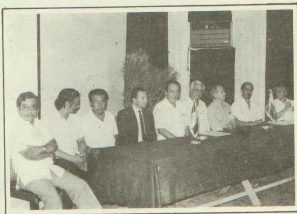
"I Encuentro de Cooperación Amazónica Peruano-Colombiano de Organismos de Investigación en Ciencia y Tecnología".

De conformidad con la Ley 24767, Ley del Presupuesto del Sector Público para 1988, se aprobó el presupuesto de apertura ascenden-