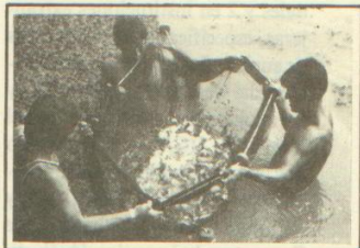
"Desarrollo de la Piscicultura en Iquitos".