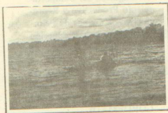
"Inventario, Bioecología y Evaluación de Recursos Hidrobiológicos en Selva Baja". Río Samiria - Cocha Atún