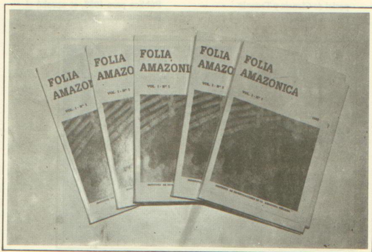
"Folia Amazónica" Revista Científica editada por el IIAP

Se ha concretado un Protocolo de Cooperación Científica con la Expedición de la Academia de Ciencias de la URSS en el Perú, para colaborar en los siguientes campos: